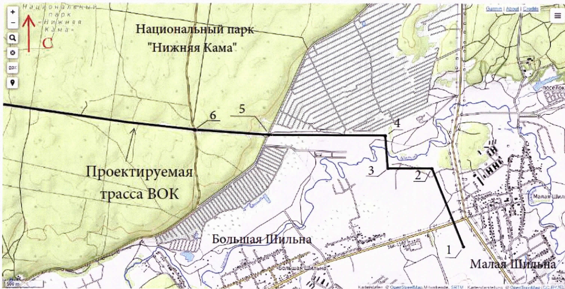
Обзорная схема происхождения проектируемого объекта по территории ФГБУ «Национальный парк «Нижняя Кама»